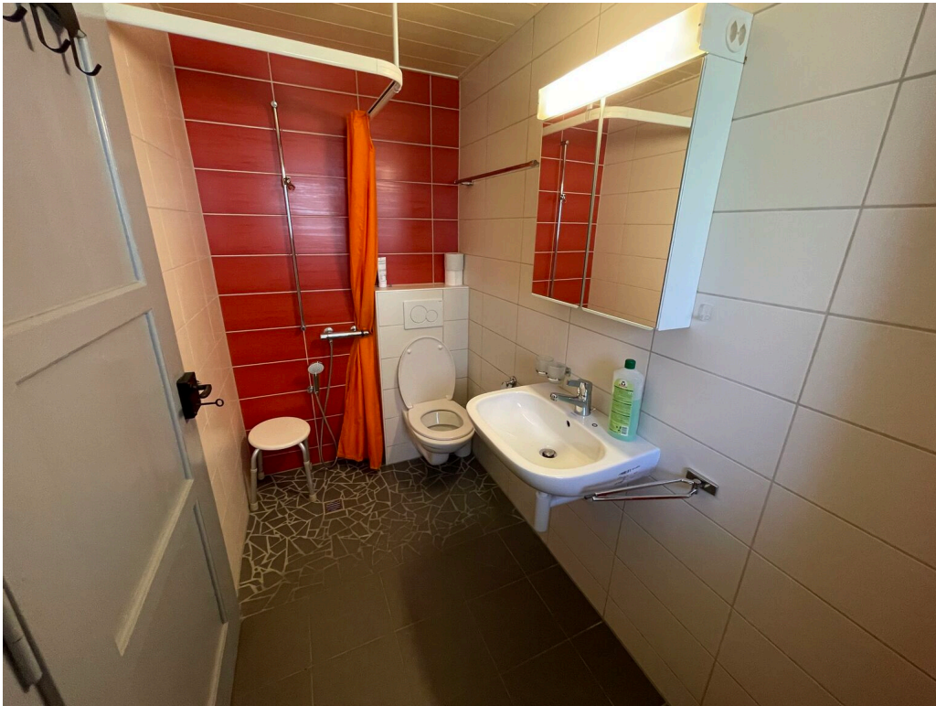
Salle de bain rdc