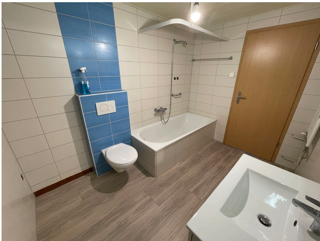
Salle de bain 1e étage