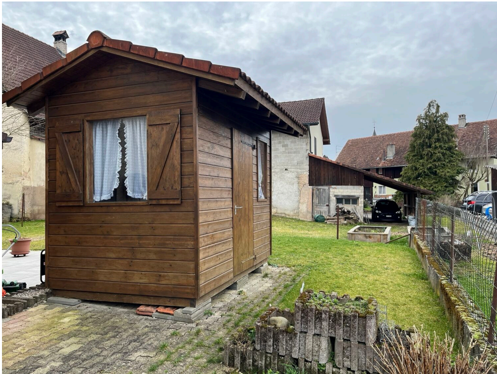
Cabanon de jardin.