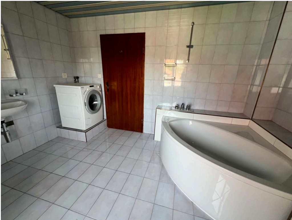
Salle de bain avec machine à laver le linge